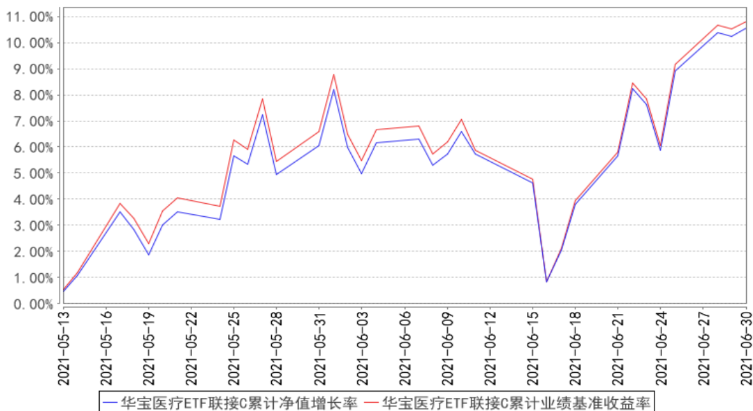
华宝医疗ETF联接C累计净值增长率与同期业绩比较基准收益率的历史走势对比图

注：1、本基金基金合同生效于 2021 年 5 月 13 日，截至报告日本基金基金合同生效未满一年。