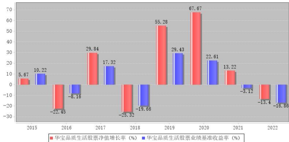
华宝品质生活股票每年净值增长率与同期业绩比较基准收益率的对比图