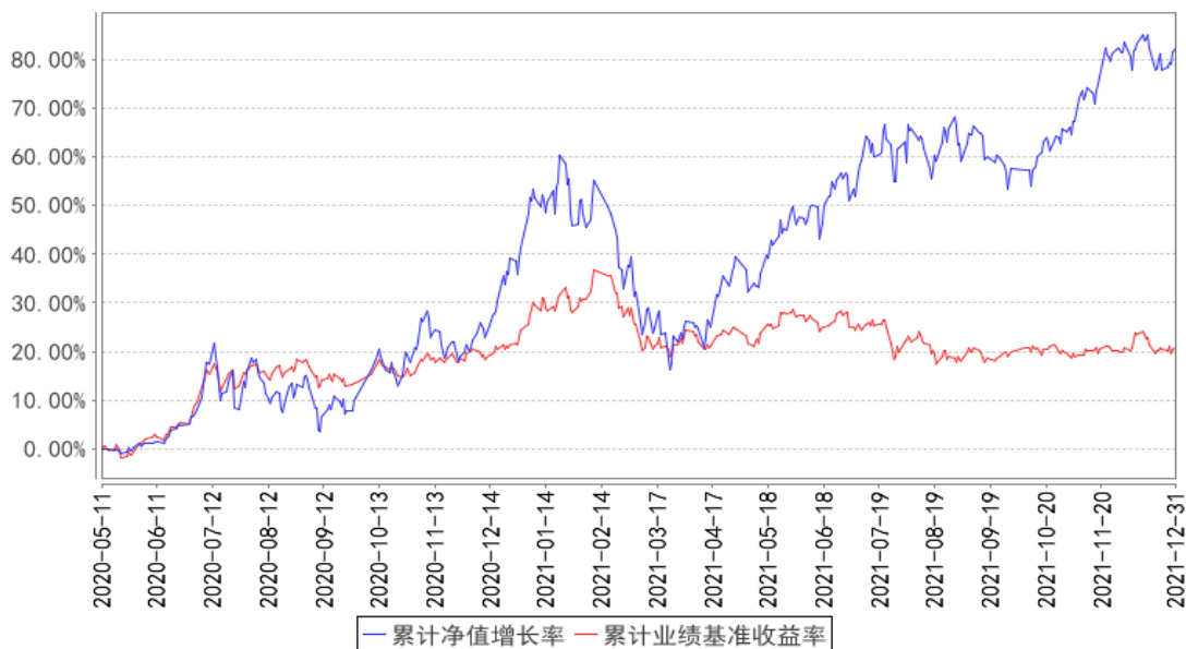
华宝成长策略混合累计净值增长率与同期业绩比较基准收益率的历史走势对比图

注：按照基金合同的约定，基金管理人应当自基金合同生效之日起 6 个月内使基金的投资组合比例符合基金合同的有关约定，截至 2020 年 11 月 09 日，本基金已达到合同规定的资产配置比例。